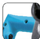
3 boutons de réglage