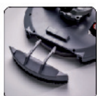
Partie détachable du plateau pour les angles